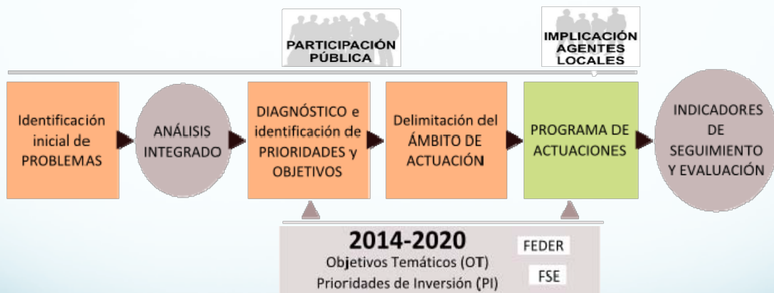
Diagrama Orientativo de desarrollo de la Estrategia Integrada

El trabajo realizado hasta ahora (31/07/2015) ha consistido en enmarcar la Estrategia de Desarrollo Urbano Sostenible e Integrado de Puertollano y plasmarla en un documento de base. Esa “enmarcación” consiste en, de forma general, en presentar un macro esquema de la Estrategia haciéndola coincidir con los planteamientos de la Comisión Europea. Es decir que el marco global de la Estrategia coincide con lo que requiere la Comisión para financiar actuaciones de esa estrategia.